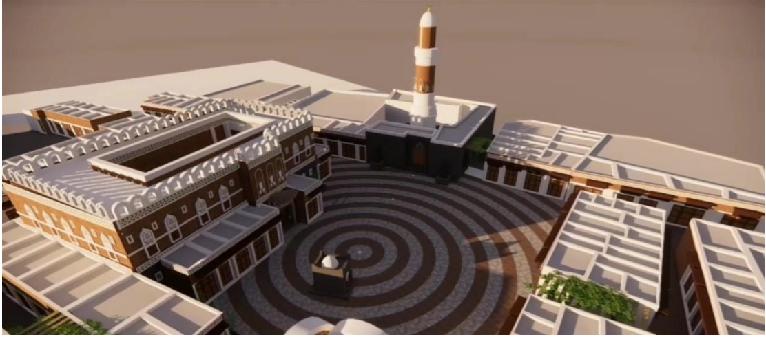
صورة ١: التصور المقترح للتأهيل